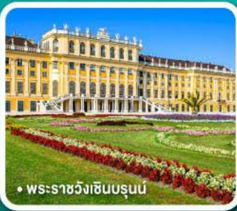
• พระราชวังเฮินบรุนน์