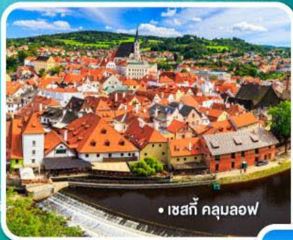
• เซสกี คลุมลอฟ